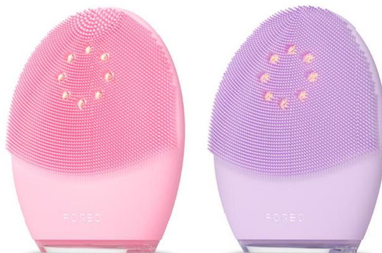
LUNA™ 4 plus Normal skin

LUNA™ 4 plus Normal skin - pro zdravou pleť s dokonalou rovnováhou oleje a vody, která není ani příliš suchá, ani příliš mastná.